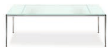
Classic Tisch 60×120 Classic coffee table 60×120