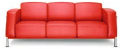
Dreier-Sofa Classic Classic 3-seater sofa