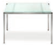
Classic Tisch 60×60 Classic coffee table 60×60