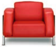
Sessel Classic Classic armchair