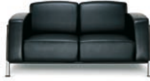
Zweier-Sofa Classic Classic 2-seater sofa